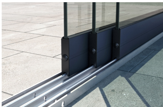
Onder rail van een 3 railsysteem